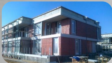
Zespół budynków mieszkalnych dla księży seniorów