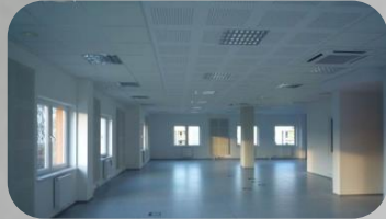
Centrum Powiadamiania Ratunkowego Gdańsk