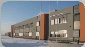
WOODWARD OBIEKT BIUROWO – PRODUKCYJNY Z INFRASTRUKTURĄ, NIEPOŁOMICE