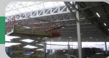
FAURECIA ROZBUDOWA ZAKŁADU PODZESPOŁÓW SAMOCHODOWYCH