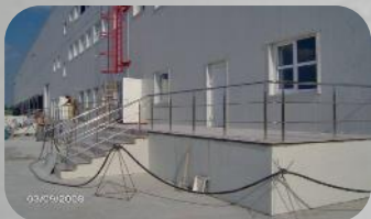
PARKIDGE DISTRIBUTION CENTER UKRAINA