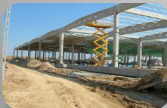
INDESIT RADOMSKO BUDOWA FABRYKI I MAGAZYNÓW