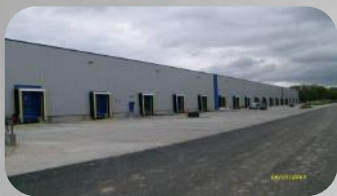
MICHELIN BUDOWA CENTRUM LOGISTYCZNEGO W PRUSZKOWIE