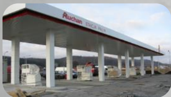
AUCHAN – 13 STACJI PALIW