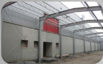
BREMBO POLAND ROZBUDOWA ODLEWNI Z OBIEKTAMI TOWARZYSZĄCYMI