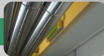
ROYAL CANIN OBIEKT PRODUKCYJNO - MAGAZYNOWY