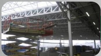
FAURECIA ROZBUDOWA ZAKŁADU PODZESPOŁÓW SAMOCHODOWYCH, GORZÓW