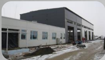
CAT BUDOWA HALI SERWISOWEJ